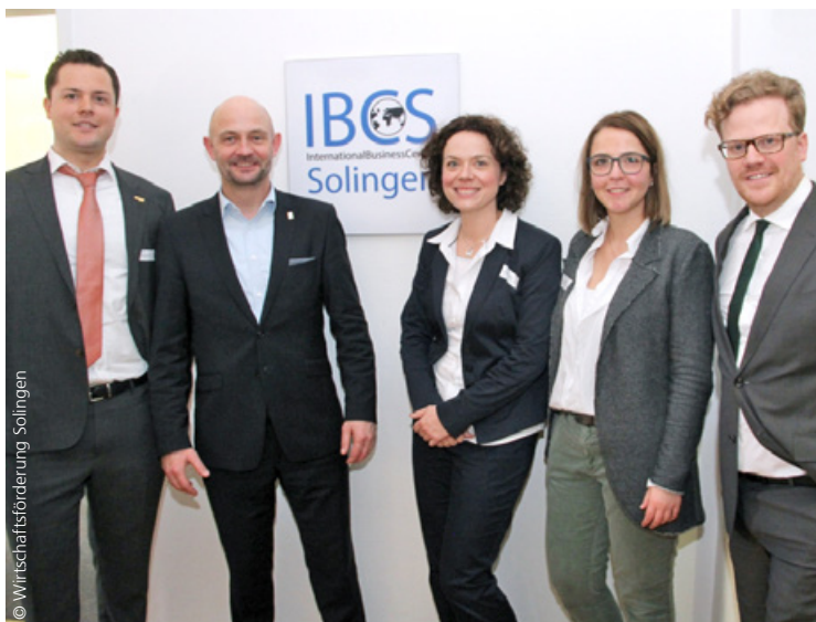
Team des International Business Center Solingen

Das IBCS unterstützt Unternehmen bei der Suche nach geeigneten Büroflächen, dem Umzug nach Solingen sowie bei der Suche und gemeinsamen Beantragung passender Fördermittel , zum Beispiel bei der KfW, Bürgschaftsbanken oder der Gründungsförderung EXIST. Ein in Solingen basierter Venture Capital Fonds investiert in Unternehmen, die sich in Solingen niederlassen wollen und ein bestehendes Netzwerk aus weiteren Fonds und privaten Investoren unterstützt die Unternehmen zusätzlich.