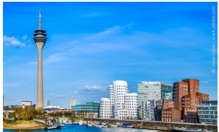
Rheinturm und Medienhafen in Düsseldorf