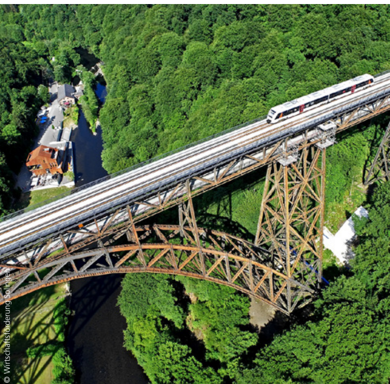
Müngstener Brücke und Brückenpark