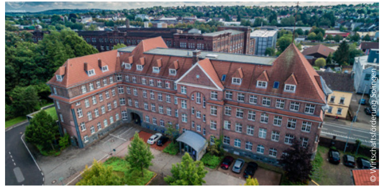
Gründer- und Technologiezentrum Solingen

Ebenfalls befindet sich im Gründer- und Technologiezentrum Solingen die Wirtschaftsförderung Solingen , die ihren KundInnen mit ihren Produkten einen Mehrwert anbietet. Zu diesen Produkten gehören: