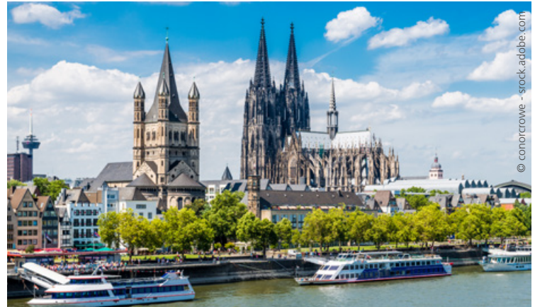
Kölner Dom am Rhein